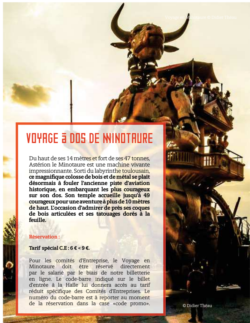
Voyage en Minotaure