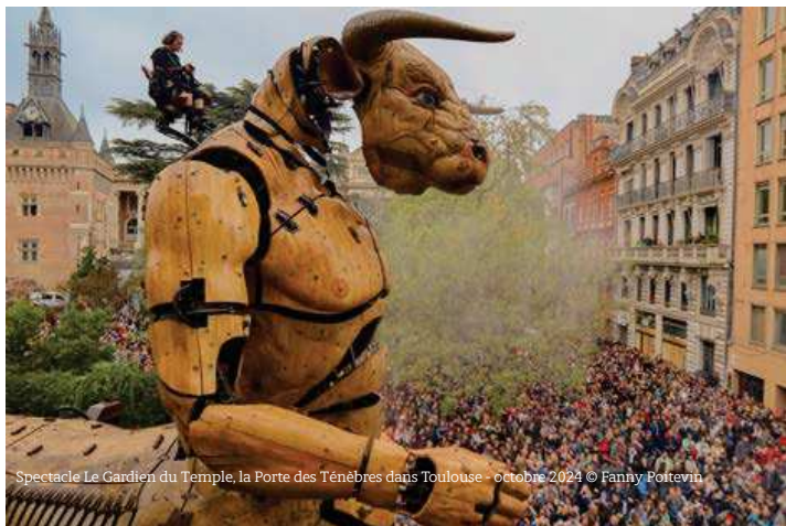
Spectacle Le Gardien du Temple, la Porte des Ténèbres dans Toulouse - octobre 2024

L'Opus II du spectacle «Le Gardien du Temple, la Porte des Ténèbres» organisé dans les rues de Toulouse du 25 au 27 octobre 2024 fut le théâtre d'intenses moments d'émotions collectives autour de ses aventures... Un million deux-cent mille personnes se donnèrent rendez-vous pour vivre l'impressionnante épopée d'Astérior le célèbre Minotaure, de Lilith la Gardienne des Ténèbres et d'Ariane la Grande Araignée.