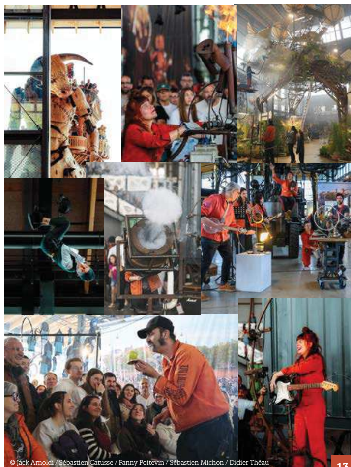
© Jack Arnoldi / Sébastien Catusse / Fanny Poitevin / Sébastien Michon / Didier Théau