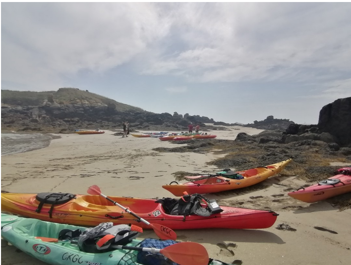
Sortie kayak à Chausey