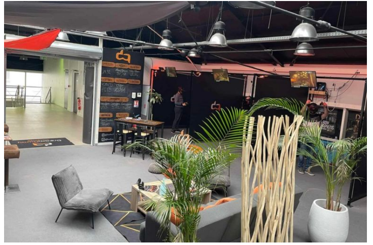
Dreamaway et le plateau de fromages/charcuteries