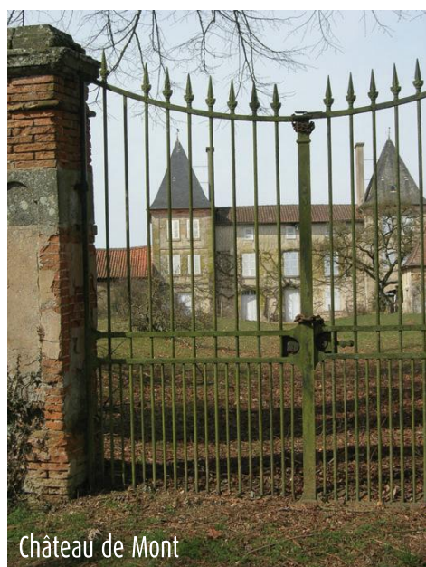
Château de Mont

C'est dans la 1ère moitié du XIIème siècle que fut édifiée la nef de l'église, puis le chœur et le transept, après un incendie en 1178. L'ancien clocher-porche carré a été remplacé par un clocher-mur après son effondrement en 1783. Elle sera ruinée à nouveau au XVIème siècle lors des guerres de Religion et les révoltes paysannes. L'abbaye se relèvera au XVIIème siècle et l'abbatiale retrouva sa fonction en 1635. (Source : Haute-Vienne Tourisme)